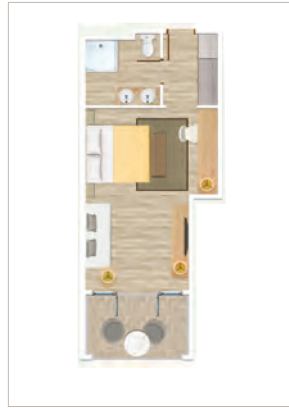
Chambre Supérieure vue sur jardin / Chambre Supérieure face à la mer