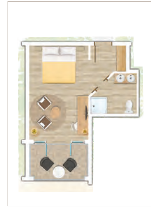
Chambre Standard face à la mer