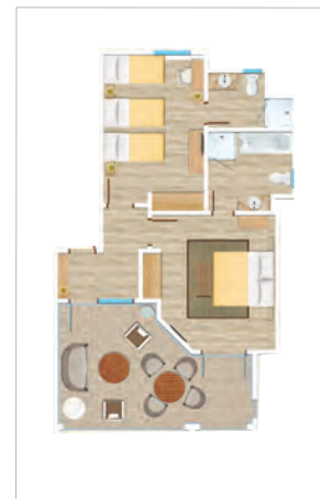
Appartement Famille de 2 chambres