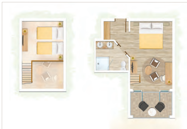
Duplex Famille vue sur jardin / Duplex Famille face à la mer