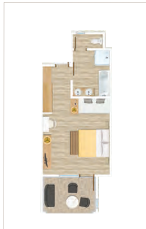
Chambre Deluxe face à la mer