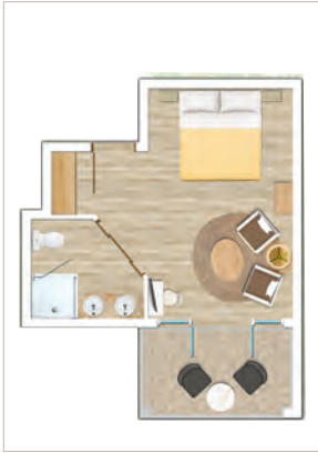
Chambre Standard vue sur jardin