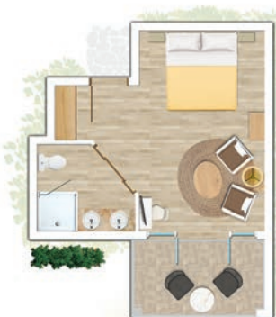
Chambre Standard vue sur jardin