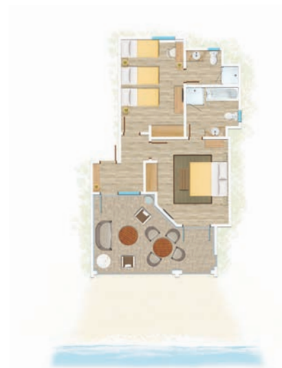
Appartement Famille de 2 chambres