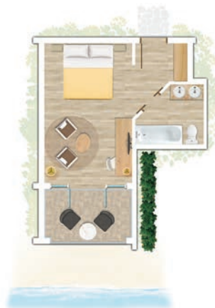
Chambre Standard face à la mer