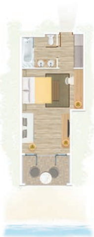
Chambre Supérieure vue sur jardin / Chambre Supérieure face à la mer