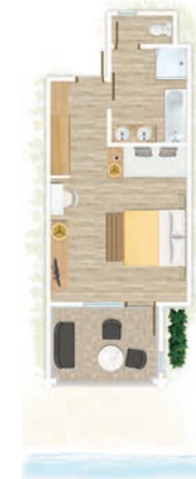
Chambre Deluxe face à la mer