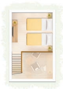
Duplex Famille vue sur jardin / Duplex Famille face à la mer