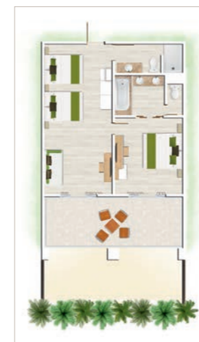
Appartement Famille de 2 chambres