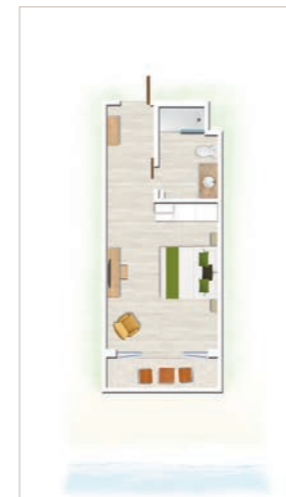
Chambre Standard / Chambre Standard Front de mer