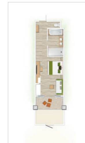
Chambre Supérieure / Chambre Supérieure Front de mer