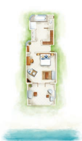
Chambre Tropicale / Chambre Tropicale Front de Mer