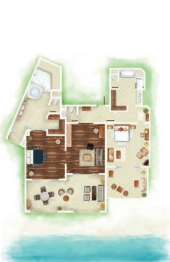
Suite Famille Deluxe Front de Mer de 2 chambres