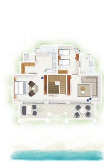
Suite Famille Océan Front de Mer de 2 chambres