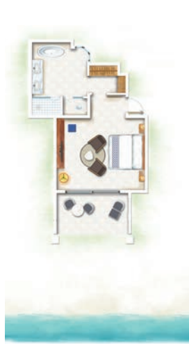
Chambre Océan Front de Mer