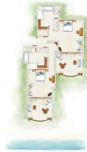
Suite Famille Tropicale de 2 chambres