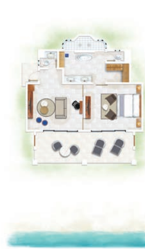
Suite Océan Front de Mer