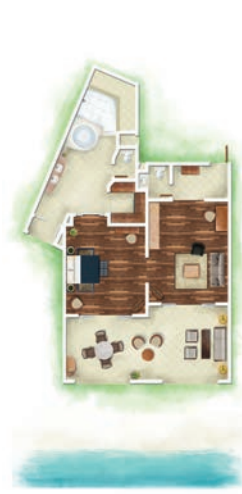
Suite Senior Front de Mer