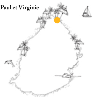
Veranda Paul et Virginie

Niché dans le pittoresque village de pêcheurs de Grand Gaube, cet hôtel réservé aux adultes est l'endroit idéal pour les couples à la recherche d'un cocon intimiste et paisible, tout en profitant d'activités et d'expériences uniques pour découvrir la région.